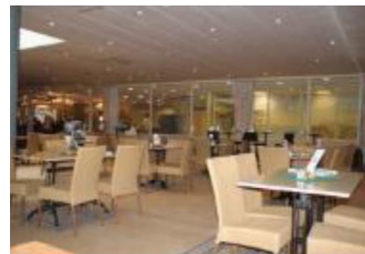
Gastronomie im Thermen-Innenbereich

Es ist keine Speisekarte mit Bildern vorhanden und Speisen werden nicht sichtbar präsentiert.