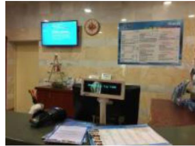
Display an der Kasse

Der Schalter/Tresen/die Kasse ist von der Eingangstür aus direkt sichtbar.